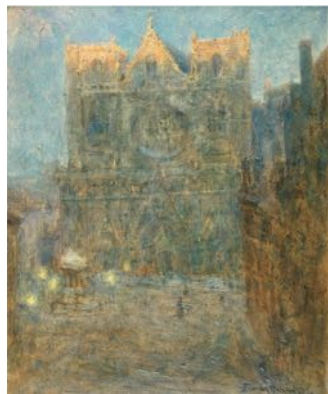
Pierre Combet-Descombes, Soleil couchant sur Saint-Jean, 1908, huile sur carton, 60 x 49,5 cm

Exposition prolongée jusqu'au 5 avril 2026