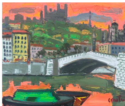
Jean Couty, Le ciel de Lyon, 1972, huile sur toile, 46 x 55 cm © Adagp, Paris 2025

Cet accrochage souligne la richesse et la diversité de la scène artistique lyonnaise du XX e siècle à nos jours et s'inscrit dans la mission du musée Jean Couty de valorisation du patrimoine artistique local et de dialogue entre héritage et création contemporaine.